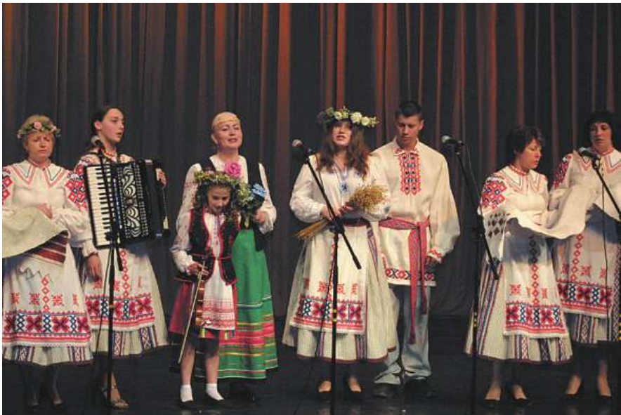
Uzstājas ansamblis "Svitanak". 2003.g. Выступае ансамбль "Сьвітанак". 2003 г.

120-годовы юбілей Якуба Коласа і Янкі Купалы ў "Сьвітанку". Спявае Ілона Варатнікова. 2002 г.