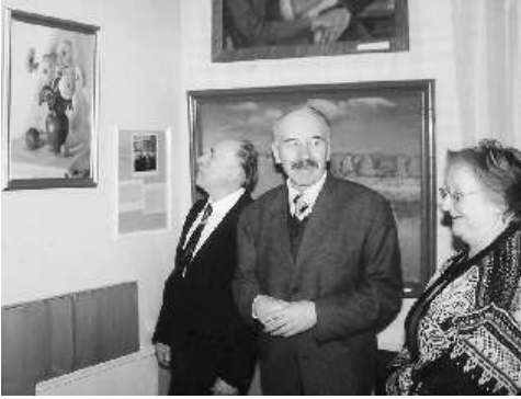
Mākslas izstādes atklāšana, kas veltīta gleznotāja Pētera Miranovič45. a simtgadei. 2002. g. Адкрыццё выставы, прысвечанай 100-м угодкам мастака Пётры Мірановіча. 2002 г.

славутых класікаў, твораў, прысвечаных ім, на беларускай мове, на вечарыне прагучалі пераклады паэзіі Купалы і Коласа на латышскую мову. Шаноўнымі гасцямі на вечарыне былі латышскія паэты і перакладчыкі Андрэйс Веянс і Кнутс Скуеныекс. А. Веянс раскажаў аб асаблівых сустрэчах з Якубам Коласам, а К. Скуеныекс прачытаў свой пераклад на латышскую мову верша "А хто там ідзе" ("Bet kas tur nāk")