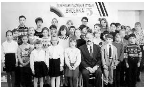
Studijas "Vjasjolka" 5-gade. 1994. g. 5-голдзе студыі "Вясёлка". 1994 г.