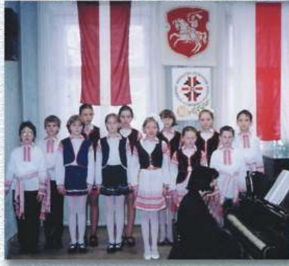
"Svitanaku" ar 10-gadi sveic Rīgas baltkrievu pamatskolas ansamblis "Vavjoračka". 1998. g. З 10-годдзем "Сьвітанак" віншуе ансамбль "Вавёрачка" Рыжскай Беларускай асноўнай школы. 1998 г.