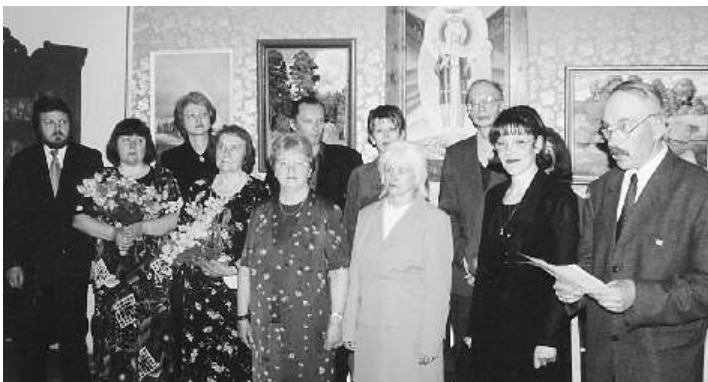
Арvientības "Maju gonar" jubilejas izstāde. 2001.g.

У 1991 г. у майстэрні мастака Вячкі Целеша ў Рызе па вул. Брывібас, 40 беларускімі мастакамі з Латвіі, Эстоніі, Ліетувы, Санкт-Пецярбурга было заснавана Аб'яднанне мастакоў-беларусаў Балтыі "Маю гонар". Пазней у склад аб'яднання ўвайшлі мастакі і са Швецыі.