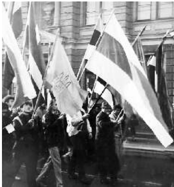
Par Latvijas neatkarību. 1990.g. . Atmoda. За незалежнасць Латвіі. Атмода. 1990 г.

Pagājušā gadsimta 80-to gadu beigās Latvijas Atmodas laikā demokrātiski noskaņotā Rīgas baltkrievu intelīģence nostājās kopīgā ierindā ar latviešiem un citu tautību pārstāvjiem, lai kopīgi atjaunotu neatkarīgo Latvijas valsti un reizē arī savu nacionālo kultūru. Turpinot K. Jezavīta un viņa līdzbiedru aizsākto darbu, tika izveidota iniciatīvas grupa, lai organizētu baltkrievu kultūras biedrību, kas turpinātu kādreizējās "Bacjkauščinas" kultūrizglītojošo darbību.