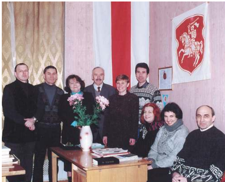
"Svitanak" Padome. 2003.g. Рада таварыства "Сьвiтанак". 2003 г.