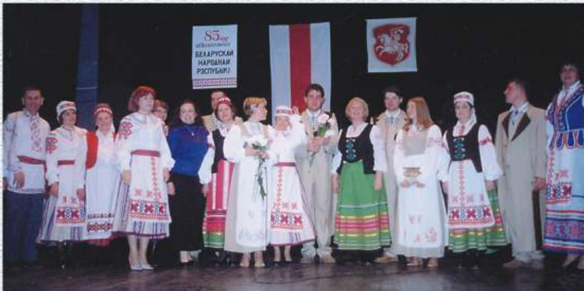
BTR proklamēšanas 85. gadadiena Rīgā. Svētku koncerta dalībnieki kopā ar viesiem - baltkrievu ansambli "Primaki" no Polijas. 2003. g. 85-я ўгодкі абвясчэння БНР у Рызе. Удзельнікі святочнага канцэрту разам з гасцямі - беларускім гуртам "Прымакі" з Польшчы. 2003 г.