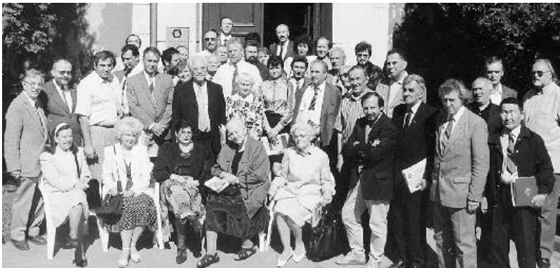
Пēc Latvijas nacionālo kultūras biedrību asociācijas konferences. 1998.g.

Latvijas baltkrievu kultūras biedrība "Svitanak" ir Latvijas nacionālo kultūras biedrību asociācijas biedre. Šo asociāciju dibināja 1988. gadā demokrātiski noskaņotas biedrības, kuras atbalstīja Latvijas neatkarību un savu nacionāli-kultūras atjaunotni. Asociācija aptver vairāk nekā divdesmit biedrības. LNKBA veic lielu darbu dažādu kultūru nacionālās attīstības, saglabāšanas un popularizēšanas jomā. Asociācijas un tās biedru piedalīšanās dažādos sabiedriskos pasākumos - tikšanās ar Latvijas valsts augstākās vadības pārstāvjiem, ar vēstniecību pārstāvjiem, ar Saeimas, ar Sorosa fonda un citu starptautisku organizāciju pārstāvjiem, dalība starptautiskās konferencēs un semināros - kuros piedalās arī "Svitanak" - liecina par lielu uzticību