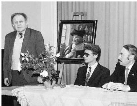
Medicīnas vēstures muzejā zinātniski populāra konference, veltīta Franč.iska Skarinas 500-gadei.

Pati aktīvākā "Svitanak" darbība ritēja Atmodas laikā nu jau pagājušā gadsimta - 80-to gadu beigās un 90-gadu pirmajā pusē. Tai laikā arī Baltkrievijā bija atmoda, ko garīgi vadīja Baltkrievijas Tautas