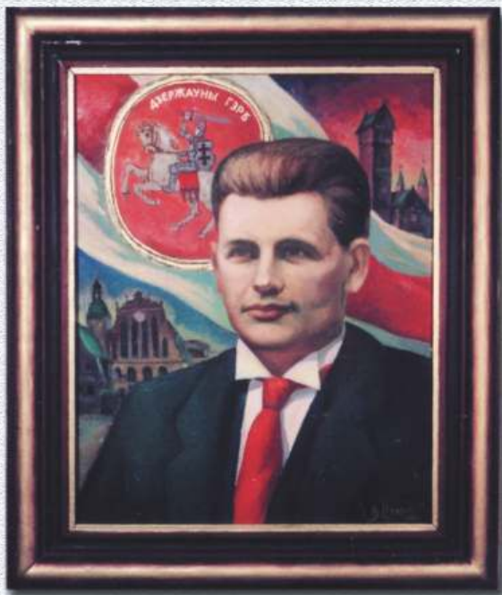
V. Teleš "Zem Pagoņas karoga" (Kastuss Jezavitavs) В.Целеш. "Пад сцягам Пагоні". (Кастусь Езавітаў)

Latvijas baltkrievu kultūras biedrības "Svitanak" izdevums Teksta autors un iekārtotājs Vjačka Teleš Redaktore Tatjana Kosuha Tulkotāja latviešu valodā Natalija Cimahoviča Izdots ar Latvijas Sabiedrības integrācijas fonda atbalstu