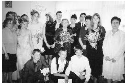
Rīgas baltkrievu pamatskolas 9. klases pirmais izlaidums. 2003.g. Першы выпуск Рыжскай беларускай асноўнай школы. 2003. г.