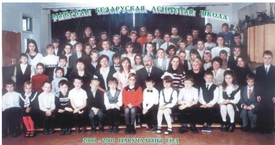
Rīgas Baltkrievu pamatskola. 2000. - 2001. m. g. Рыжская беларуская асноўная школа. 2000-2001 навуцальны год.