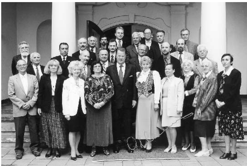
Tautību Konsultatīva Padome ar Prezidentu Gunti Ulmani. 1999. g. Кансультатывная Рада па нацыянальных пытаннях з Прэзідэнтам Латвіі Г. Ульманісам. 1999 г.

У далейшым Латвійскае таварыства беларускай культуры "Сьвітанак" бачыць неабходным захоўваць і развіваць культуру беларусаў у Латвіі як частку сусветнай культуры, існаванне якой немагчыма без шматлікасці розных культур і кантактаў паміж імі, а таксама падтрымліваць палітыку Латвійскай дзяржавы ў галіне інтэграцыі нацыянальных культур.