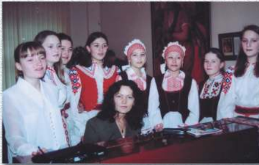
Rīgas baltkrievu pamatskolas ansamblis "Vavjoračka". 2002. g. Ансамбль "Вавёрачка" Рыжскай Беларускай асноўнай школы. 2002 г.